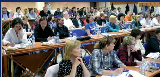
Kongresový sál hotelu OLYMPIA v České Lípě

Objednat se můžete telefonicky na čísle 731 102 712 , e-mailem na skoleni@jezksv.cz nebo na www stránkách kurzů v sekci Školení, kde získáte i podrobné informace o obou akcích.